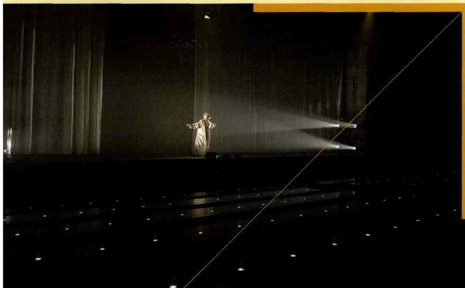
A sinistra, il Teatro della Luce. Qui sotto, una foto dell'esterno del Kalidria Grand Hotel & Thalasso Spa